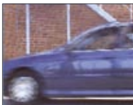
Entrelazado, 20 ms diferencia entre líneas pares y líneas impares