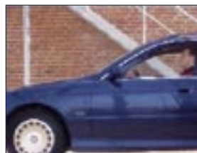
Barrido progresivo, todas las líneas se muestran a la vez